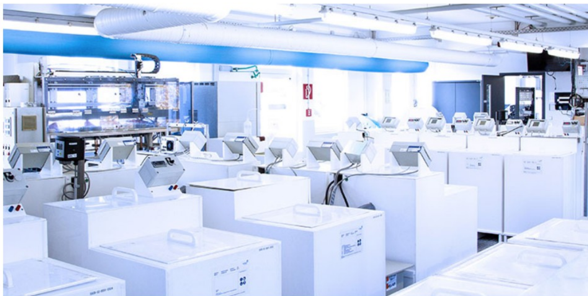
Umicore MDS hat weltweit seine Galvanikzentren entsprechend angepasst, um die Beschichtung von Titankomponenten für PEM-Elektrolyseure jederzeit in Kundennähe und ohne lange Transportwege durchführen zu können.

Da die Platinbeschichtung von Umicore technisch ausgereift ist, lassen sich mit dem fortschrittlichen Verfahren sich auch sehr dünne, homogene Platinschichten hochpräzise auf Titankomponenten abscheiden, die aufgrund ihres Matrixzustandes eine bestmögliche Elektronenleitfähigkeit und damit einen hervorragenden Wirkungsgrad erzielen. Darüber hinaus wird eine optimale Schichtdickenverteilung für das jeweilige System gewährt. Dies hilft, den Edelmetalleinsatz und damit die Kosten hierfür im Vergleich zu bisherigen Beschichtungsverfahren zu reduzieren, was sich insbesondere bei großen Stückzahlen schnell positiv bemerkbar macht und so die Voraussetzungen für eine industrielle Skalierbarkeit schafft.