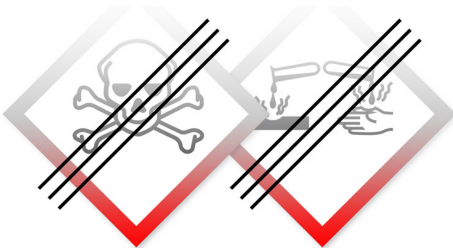
Umicore ist es gelungen, eine qualitativ gleichwertige und dauerhafte Verbindung zwischen dem BPL- und PTL-Basismaterial Titan und dem aufzubringenden Platin ohne den Einsatz stark korrosiver oder toxischer Chemikalien herzustellen.

Aufgrund ihrer hochgiftigen und ätzenden Eigenschaften kann die oben erwähnte Flußsäure bei direktem Kontakt oder Einatmen schwere Gesundheitsschäden verursachen, einschließlich schwerer Verbrennungen, Augenschäden und Atembeschwerden. Zudem erfordert die Verwendung strenge Auflagen und spezielle Lagerbehälter, um die Sicherheit der Mitarbeiter und der Umwelt zu gewährleisten. Zusammen mit dem deswegen zusätzlich erforderlichen bürokratischen Aufwand ist für eine wachsende Zahl von Unternehmen die Nutzung von derartigen Stoffen nicht mehr mit Nachhaltigkeitszielen in Einklang zu bringen.