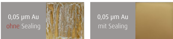
0,05 µm Au ohne Sealing

Ausgezeichnete Beständigkeit im Salzsprühtest 72h NSS Test mit Sealing 692 (Ni/Au beschichtet)