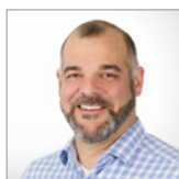
Frank Friebe Vertrieb Elektrokatalytische Elektroden

Sie haben tieferegehende Fragen oder wünschen eine unverbindliche Angebotskalkulation? Unser Fachmann hilft Ihnen, natürlich auch bei technischen Fragen, gerne weiter.