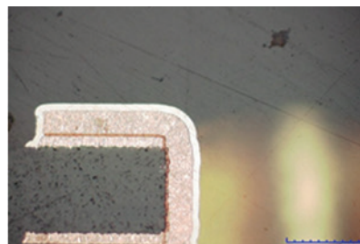
Querschliffaufnahmen nach OSP-Behandlung