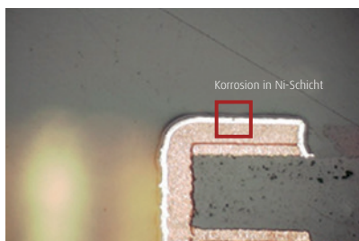
Querschliffaufnahmen nach OSP-Behandlung

Konventioneller Goldelektrolyt mit Austauschreaktion