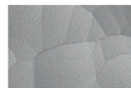
REM-Aufnahme nach dem Strippen des Goldüberzugs